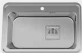
EL78SXF EL78SXF, GTIN 7393069019001