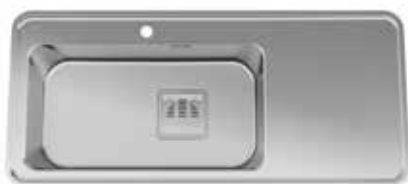
EL114SXRF Kum høyre, GTIN 7393069019018 EL114SXLF Kum venstre, GTIN 7393069019025